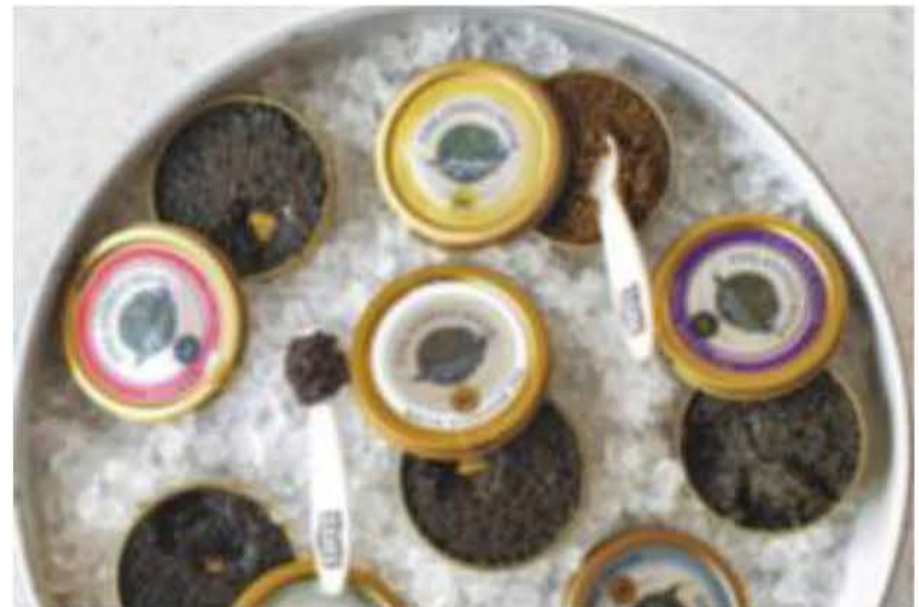
Vodka og kaviar skal der til, når du er gæst i det høje, kolde nord.

markedsplads og kun et stenkast fra Esplanade Park. Nyd de højloftede værelser med havudsigt, spis på de enestående restauranter, og drik nightcaps i den legendariske bar.