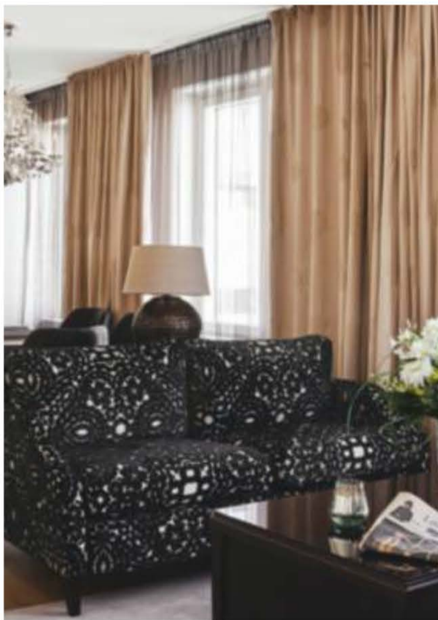
Boutiquehotellet Haven er moderne på den kølige, skandinaviske måde.