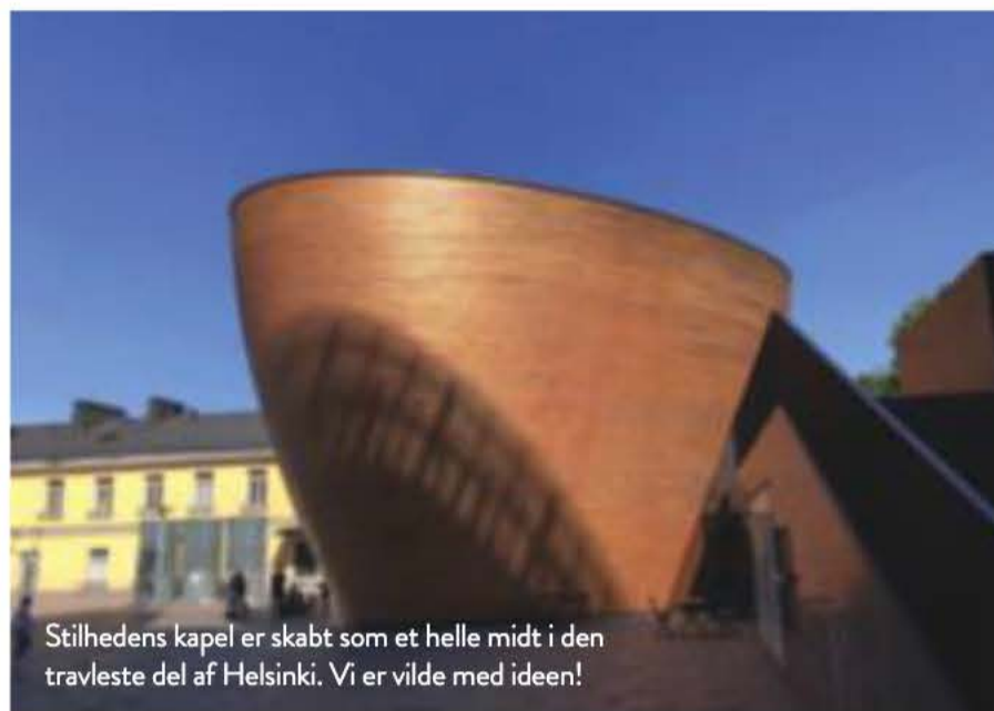
Stilhedens kapel er skabt som et helle midt i den travleste del af Helsinki. Vi er vilde med ideen!