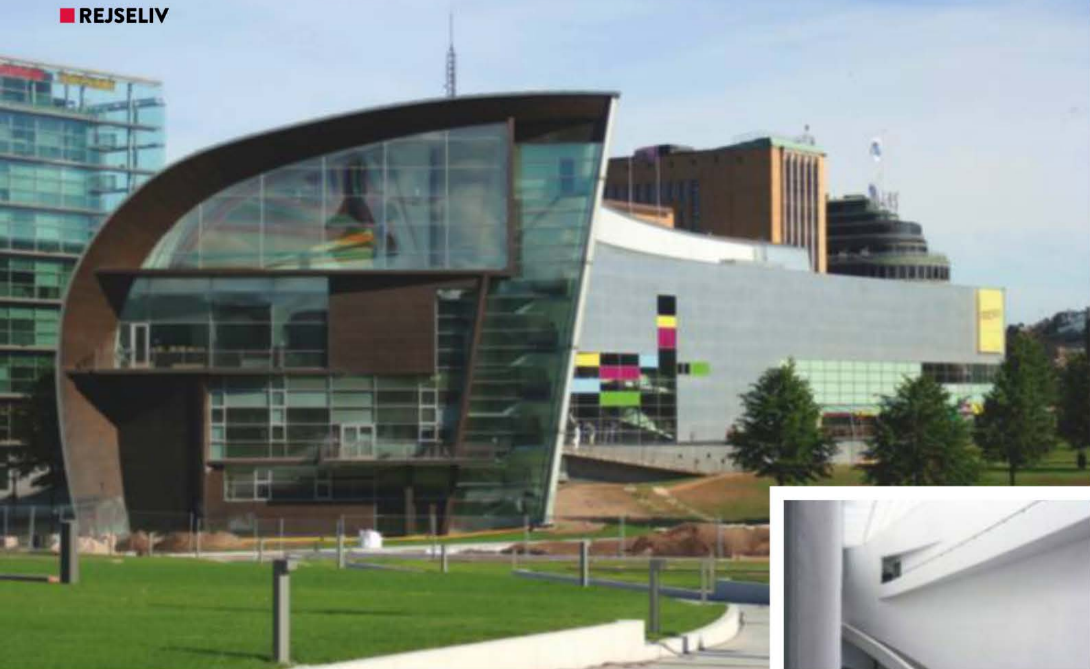
Kiasma hedder Helsinkis museum for samtidskunst, hvor du skal holde øje med de skiftende udstillinger.

Hver eneste arkitektoniske og dekorative detalje er gennemtænkt, og huset er sjovt at gå på opdagelse i. Det ligger i kvarteret Kluuvi nær hovedbanegården og Kiasma-museet.”