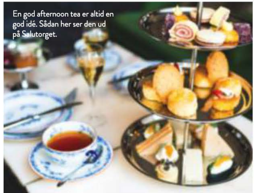
En god afternoon tea er altid en god idé. Sådan her ser den ud på Salutorget.