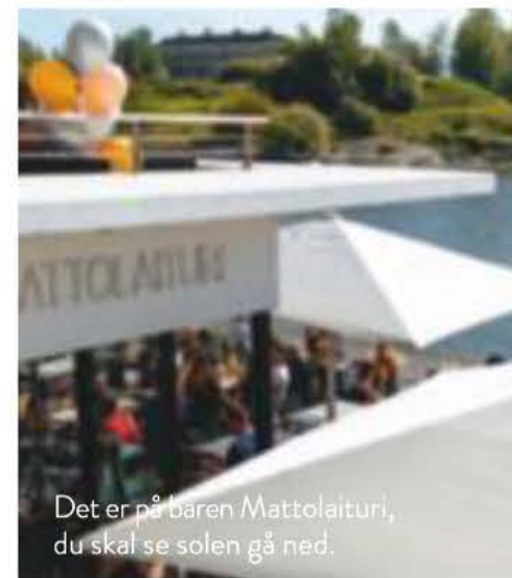
Det er på baren Mattolaituri, du skal se solen gå ned.

En dampende varm pool og kølig luft i ansigtet kan du få på Allas Sea Pool, der naturligvis også har sauna. Og en saltvandspool.