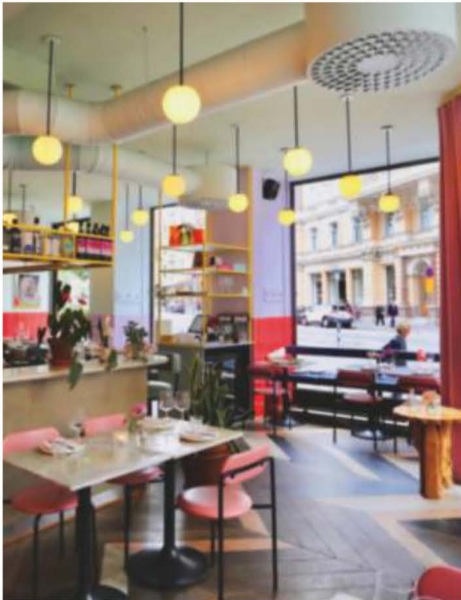
Er du til pink, vil dit lille hjerte stønne "yes yes yes" ved synet af restauranten, der hedder netop det.