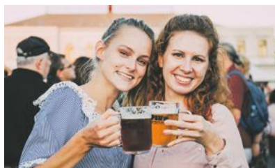
Pražský festival piva i Prag lockar många ölskåkare.

Upplevelser som kan beskrivas som ro- och energigivande, och på så vis välgörande. Men än så länge mer hotell än hospital.