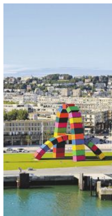
Normandie är redo för festligheter.

Frankrikes kustlinje utmed Engelska kanalen har inspirerat flera av landets främsta konstnärer. Där bland Claude Monet, uppvuxen i Le Havre, som förevigade den gång på gång. För att markera 150-årsjubileet av den första impressionistiska utställningen 1874, är årets upplaga av regionala kulturarrangemangen Normandie Impressionniste något i särklass. Dess utställningar, föreställningar och samtal kombineras gärna med god fisk på Les Enfants Sages, cider på La Petite Rade och sömn på Vent d'Ouest. normandie-impressionniste.fr