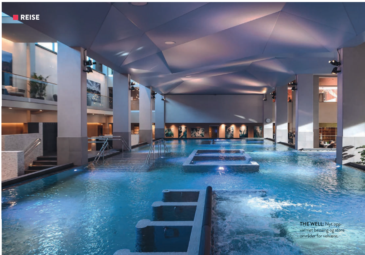
THE WELL: Nyt oppvarmet basseng og store områder for velvære.