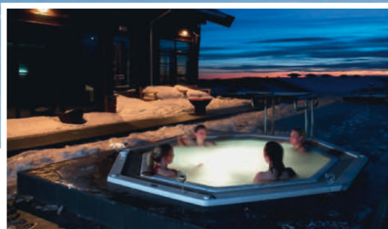
VINTERLAND: På Norefjell Ski & Spa kan gjestene vente seg en herlig kombinasjon av fjell og velvære.