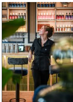
Hernö Gin Hotell lockar ginälskare till Härnösand.