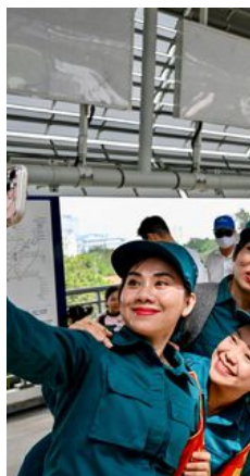
Äntligen rullar Ho Chi Minh-stadens metro.

Ett decennium försenat och många miljarder dyrare än budgeterat – byggandet av Ho Chi Minh-stadens första metro är något av Vietnams svar på Slussenbygget i Stockholm. Men nu är den äntligen (delvis) invigd, med förhoppningen att minska stadens beryktade trafikproblem och även bli ett enkelt sätt för turister att ta sig runt. Än så länge rullar endast en linje, mellan Ben Thanhmarknaden i centrum och bussterminalen Soui Tin via krogkvarteren i Thao Dien, men under kommande år ska ytterligare sju linjer öppnas. SvD