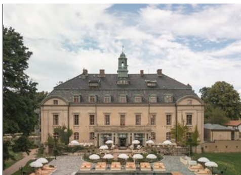
Slottet i Glumslöv har fått ett ansiktslyft.