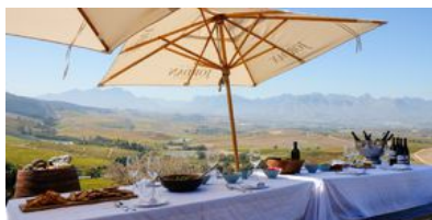
Safari för fin-smakare i Kapstaden.