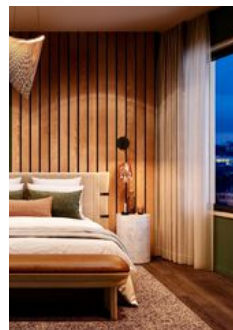
Lokal design och heta bad på Elite Hotel Frost.

"En oförglömligt lyxig hyllning till Kirunas rika historia och hänförande natur." Ja, det är stora ord när Elite Hotel Frost beskriver sig själv. Men vi säger inte emot. Centrala Kirunas nya hotellstjärna är en välbesegrad weekenddestination i dova färger, med två restauranger, skybar och ett generöst spa som breder ut sig på översta våningen. Här tillbringar man gärna dagen i bastur, hamam, behandlingsrum och infinitypools med utsikt över Kirunas landskap. Med lite tur kanske även norrskenet visar sig. elite.se