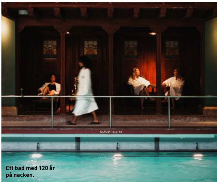
Ett bad med 120 år på nacken.