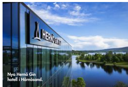
Nya Hernö Gin hotell i Härnösand.

Njut av slingrande älv, barrig skog och mossiga berg.