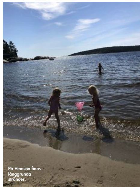
På Hemsön finns långgrundna stränder.

På Hemsön hittar ni även havsbadet Sågsand, med långgrund, kristallklart vatten och fast botten, perfekt för familjer med små barn som gillar att leta småfisk vid vattenbrynet. Större barn kanske hellre vill vara med och hyra kajak eller cykla via