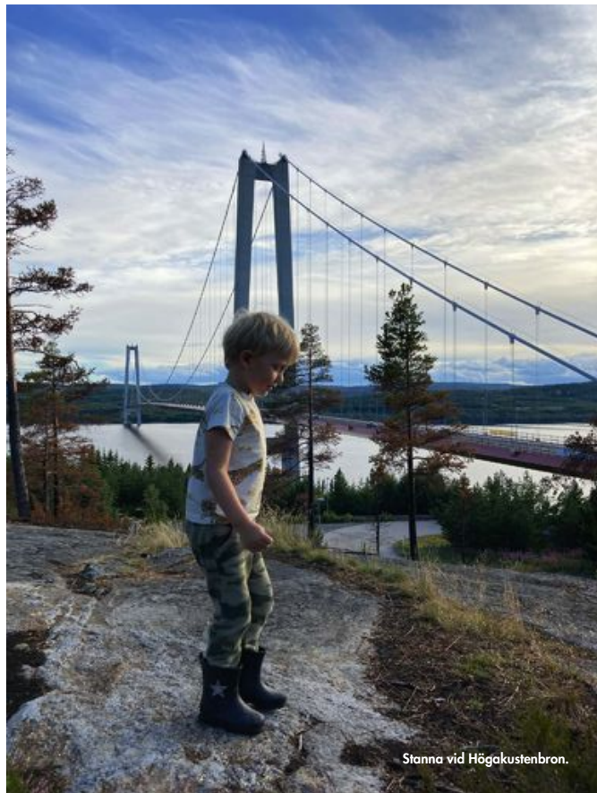
Stanna vid Högakustenbron.