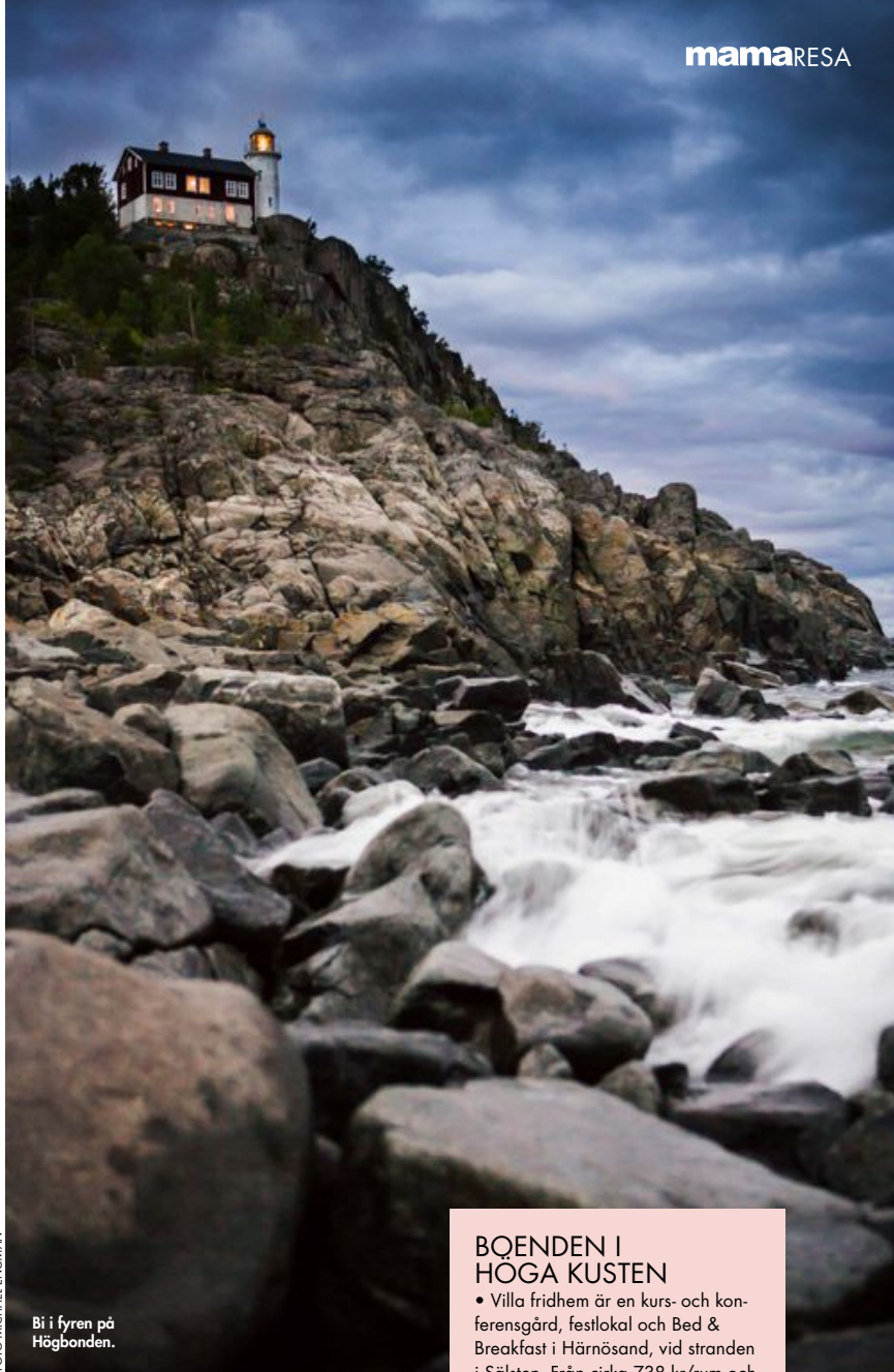
Bi i fyren på Högbonden.

I Örnsköldsvik hittar ni Paradiset upplevelsebad. Om ni har lite större barn i familjen kanske de redan känner till monster-rutschkanan "Magic Eye" på 181 meter? Som man åker ner i via uppblåsbara ringar. Annars kan det bli en finfin överraskning. Här finns även virvlande forsar, mini-badland med tropiskt tema för de minsta samt spa och träningsmöjligheter för föräldrar som har lite egentid.