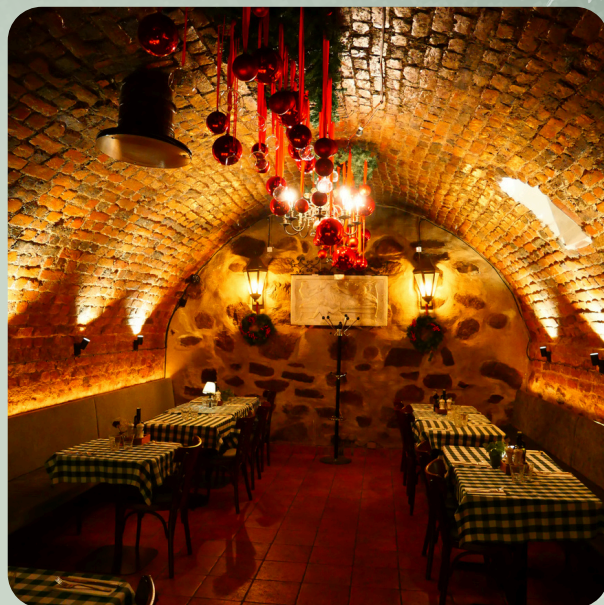
Valv 2: Rymmer upp till 30 personer

Båda valven kan bokas tillsammans och ligger sida vid sida, där en inbjudande buffé i mitten skapar en härlig samlingspunkt för gästerna.